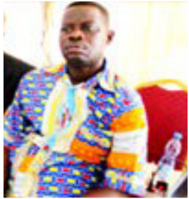
Par Ernest ITENDE

Dans la présente étude, nous publions la synthèse de deux résultats d'analyse de cadre de concertation initiés par les organisations de la commune de Bandalungwa et celle Selembao, dans la ville province de Kinshasa.