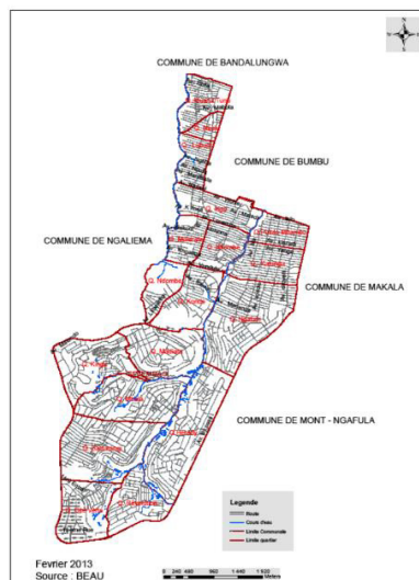
Figure 2. Présentation de la carte administrative de la Commune de Selembao

Matadi qui constituent deux tronçons de la route nationale n°1